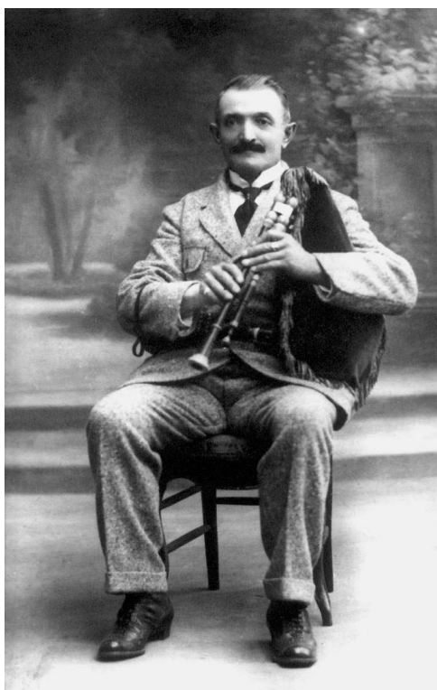
Archives André Ricros